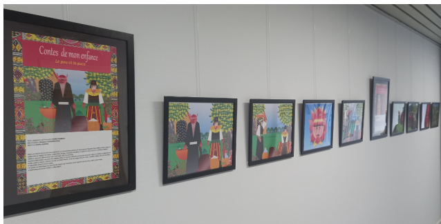
Exposition au Bip Josse Mai 2025