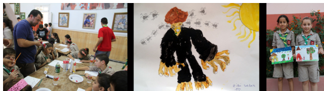
Ateliers, exposition, Théâtre Régional de Bejaia - Algérie