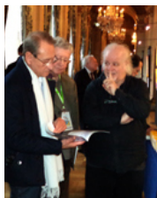
IMA à Paris