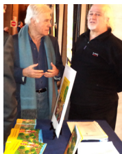
Hôtel de Ville de Paris