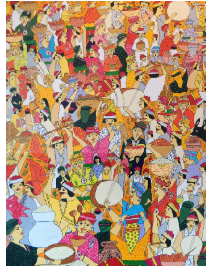
Œuvres, illustrant la fête de Yennayer et ses traditions.