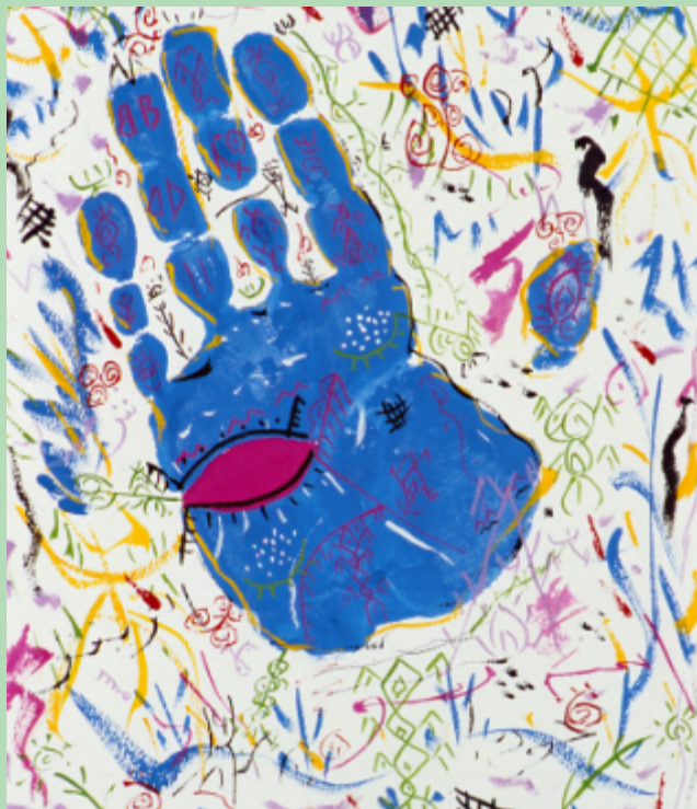
Les Mains de l'Espoir, un projet international en faveur de la paix

Pensée comme une manifestation familiale, éducative et inclusive, cette célébration vise à faire reconnaître la richesse artistique et symbolique de la culture amazighe dans un haut lieu de culture, de spiritualité et de dialogue.